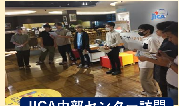
JICA中部センター訪問