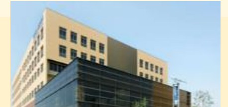
名古屋出入国在留管理局

https://www.jica.go.jp/domestic/nagoya-hiroba/about/chubu/index.html