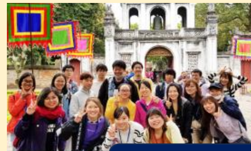
本学海外研修プログラム

https://www.centrair.jp/event/enjoy/airplane/index.html