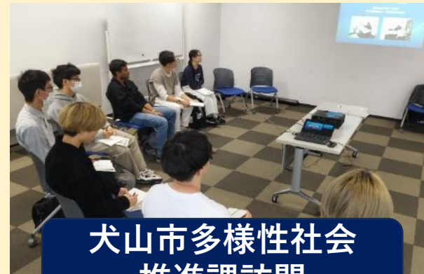
犬山市多様性社会 推進課訪問