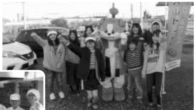
「犬山ドッグ最高~!」と大喜び