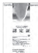
サプリメント管理士 認定証