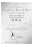
ダイエットコーディネーター 認定証