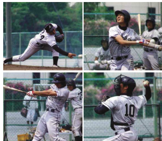
愛知大学野球連盟春季リーグ戦(Ⅲ部)結果 4位 6勝6敗 勝ち点3