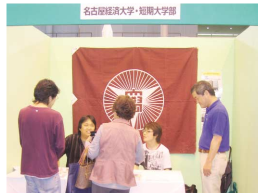
市民の皆さんから相談を受けました。

また5月24日、25日に、パークアリーナ小牧にて小牧市商工会議所主催の『こまき産業フェスタ2008』が開催されました。本学からはキャリアセンター員と大学祭実行委員会の学生が出席し、市民に資格取得支援講座受講と本学図書館利用を案内しました。これは、本学が地域の活性化に寄与することを目的として