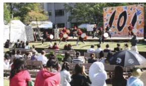
去年の名経祭から

A. 自然が豊かだと思います。4月には、桜並木や桃の花などが見られて、とても綺麗です。5、6月には竹や新緑などが初々しく爽やかです。夏には、長良川で鯉釣りや近くの田縣神社でお祭りがあり、おもしろく楽しいですね。10月には、名経祭があって、地元でも大学でも楽しめるのが、名古屋経済大学の良さだと思います。