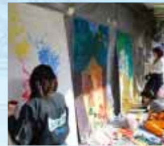
学生によるライブイベント

小牧アートフェスタは小牧の上街道で行われた、商店街と市民と学生のコラボレーションによってできるお祭りです。私が小牧アートフェスタに関わったのは11月からでしたが、3月の本番に向け会議は毎週のように行われ、会議の間では商店街・市民・学生それぞれが分け隔て無く意見を述べ合い、メンバーのイベントにかける熱意は回を重ねるごとに大きくまとまってきました。また実際に商店街を歩き話を聞いてまとめた瓦版を作ったり、ボランティアとして協力して下さった大学や企業へあいさつ回りもしました。