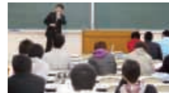
フレッシューズセミナー