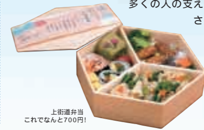
上街道弁当 これぞなんと700円!

このお祭りに参加したことで、大学と地域とのつながり、人と人のつながりの大切さを実感することが出来ました。多くの人の支えがあったからこそ、成功させることができたのだと思います。この「上街道弁当」の販売を通して得たもの、学んだことを、これからの人生にも生かして行きたいと思っています。