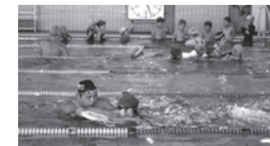
驚くほど上達した泳力

●ちびっこ水泳教室 1期 7月23日~26日 2期 7月30日~8月2日 (1・2期ともに全4回) フロイデ温水プール