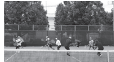
短時間で上達し、ゲームでラリー