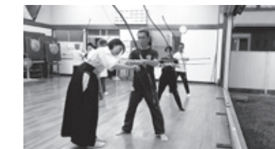
矢を射る難しさを体験