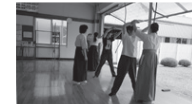
コツをつかむまで何度も練習