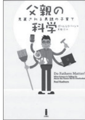
父親の科学 ポール・レイバーン著

日本のカブトムシ・クワガタムシ全種をはじめ、世界の主なカブトムシやクワガタムシ、コガネムシを写真で紹介。スマートフォンで3DCGと動画が見られるマークあり。カブト・クワガタバトル等を取めたDVD、ポスター付き。