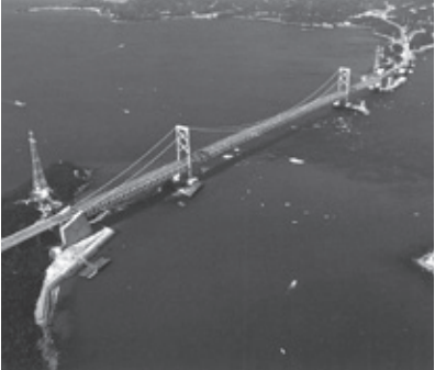
大鳴門橋 日本橋梁建設協会編「日本の橋（増訂版）—多彩な鋼橋の百余年史—」（朝倉書店、1994年刊）より