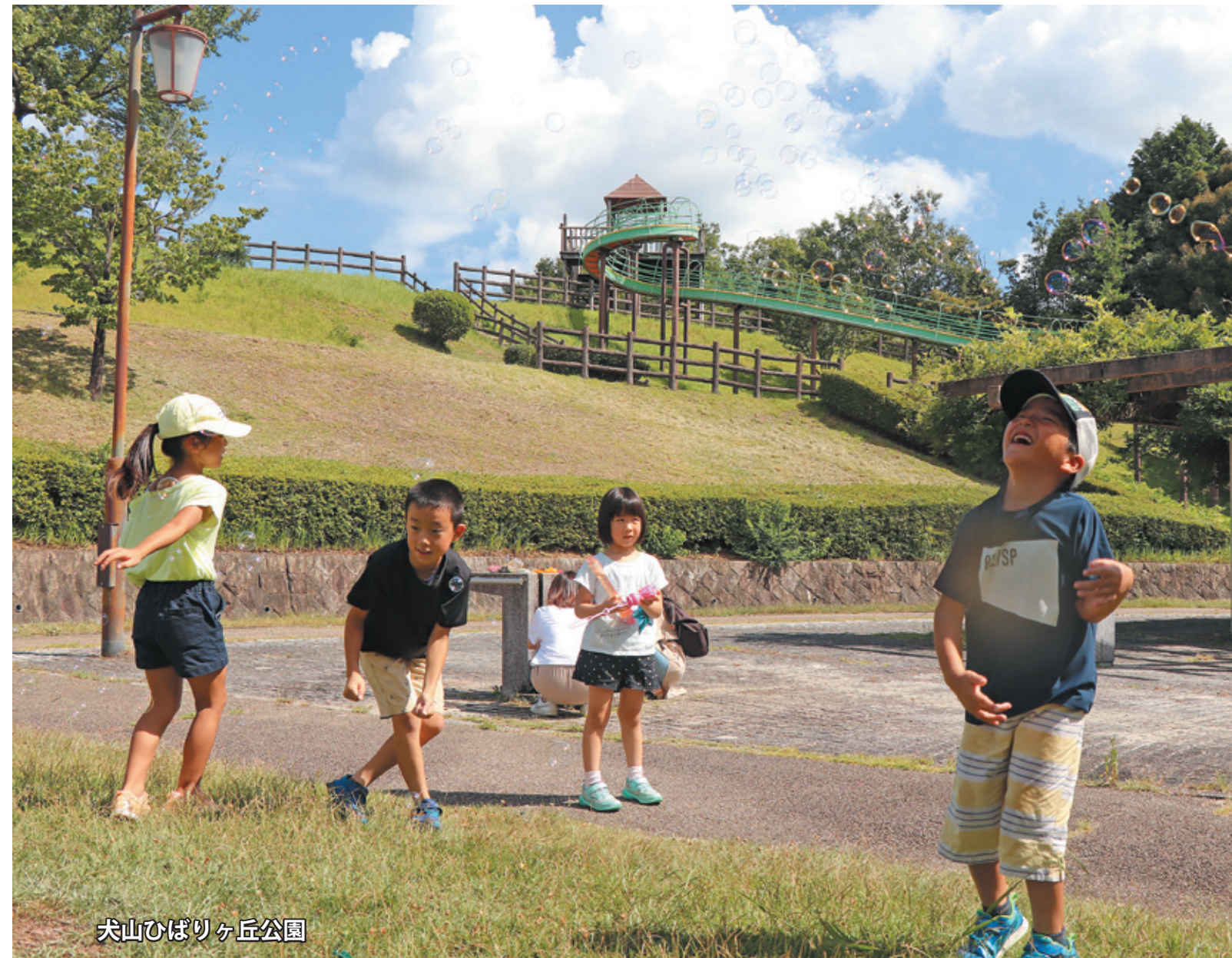
犬山ひばりヶ丘公園