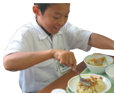
▲ピラフの山に、石に見立てた唐揚げを積み上げて食べる生徒

市内で行われる「石上げ祭」に関連して、名古屋経済大学の学生と犬山商工会議所が、祭りをイメージして考案した「石上げピラフ」の給食アレンジ版が、登場しました。商工会議所とは、この他に「犬山ドッグ」についても連携しています（8月15日号参照）。