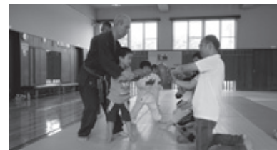
親子で「突き」「蹴り」を体験

●ソフトテニス初心者教室 6月8日~令和2年3月21日 (全20回)山の田公園テニス場