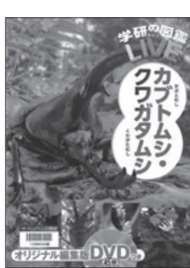
カブトムシ・クワガタムシ 岡島秀治総監修

今の日本に続く国家、そして社会の原型が作られた弥生時代。この時代を知ることが、今を生きるヒントになる！衣食住や祭祀、遺跡など、知っているようで知らない弥生時代の基礎知識を、イラストとともに紹介する。