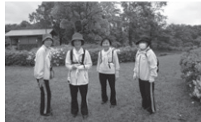
▲健康づくり推進員の皆さん