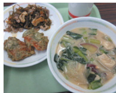
▲学生が考えた給食

児童生徒は考案した学生と一緒に給食を食べ、ミニ食育を受けることで、食への関心が高まります。名古屋経済大学とはこの他に、朝食摂取に関する食育でも連携しています。