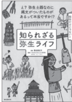
知られざる弥生ライフ 譽田亜紀子著

今の日本に続く国家、そして社会の原型が作られた弥生時代。この時代を知ることが、今を生きるヒントになる！衣食住や祭祀、遺跡など、知っているようで知らない弥生時代の基礎知識を、イラストとともに紹介する。