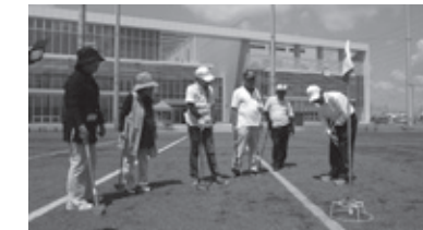
真剣に指導者の説明を聞いて基本練習

●グラウンド・ゴルフ初心者教室 6月11日~9月10日(全4回) 羽黒中央公園多目的スポーツ広場