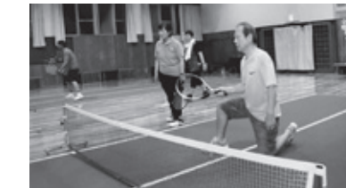
ポレーもできるようになり、ゲームにトライ