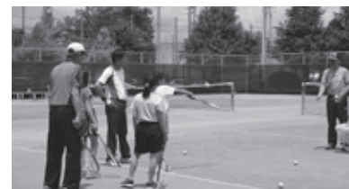
ソフトテニスを基本から楽しく習得

●ソフトテニス初心者教室 6月8日~令和2年3月21日 (全20回)山の田公園テニス場