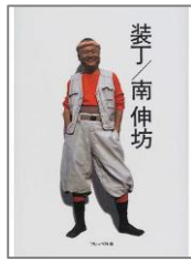
装丁 / 南伸坊 022. 5/Mi37

いま世界の哲学者が考えていること Philosophical challenges in the 21st century / 岡本裕一 朗著 104/042