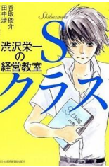
渋沢栄一の経営教室 : S (Shibusawa) クラス / 香取俊介, 田中渉著 913. 6/Sh21

百姓が地球を救う : 安心安全な食へ“農業ルネサンス” / 木村秋則著 615/Ki39