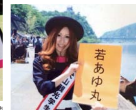
うかい船「若あゆ丸」を紹介