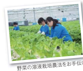
野菜の溶液栽培農法をお手伝い

「共生社会の探究」では、8月25日(月)~29日(金)の5日間、宮城県仙台市沿岸部や女川町を訪問しました。1日目は、南三陸鉄道女川駅の建設や道路・土地の底上げ整備が最終段階となった女川町を地元ボランティアガイドの方の案内で実地検証し、生徒の7割が命を落とした大川小学校を見聞しました。