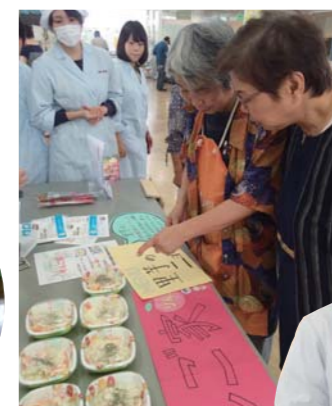
素材へのこだわりと愛情がいっぱいつまっています

里芋は・・・ 食物繊維とカリウムが豊富! ほかのイモ類に比べて水分が多く、炭水化物が少ないため「低カロリー」です。