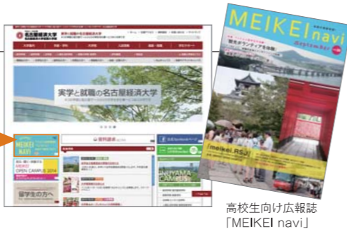
高校生向け広報誌「MEIKEI navi」