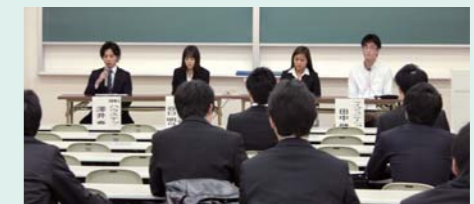
昨年の報告会の模様

就職が内定した大学4年生と短期大学部2年生が、これから就職活動を開始しようとする大学3年生と短期大学部1年生を対象に、自らの就職活動の体験を語る講演会。毎年2月に行われます。