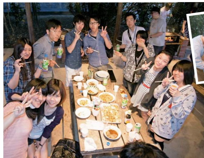
飲んで、食べて、会話して...大満足の笑顔

ISSの交流イベント第2弾は、「BBQ(バーベキュー)パーティー」。5月30日(金)、学内のバーベキューコーナーを貸し切って、盛大なパーティーが行われました。お肉に焼きそば、野菜もたっぷり用意され、美味しさも雰囲気も「はなまる!」参加者全員が大満足のイベントとなりました。