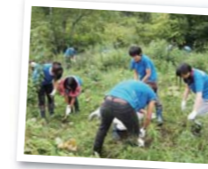
「ゆめハウス」で畑の整備