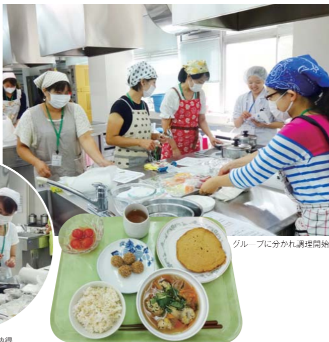
グループに分かれ調理開始