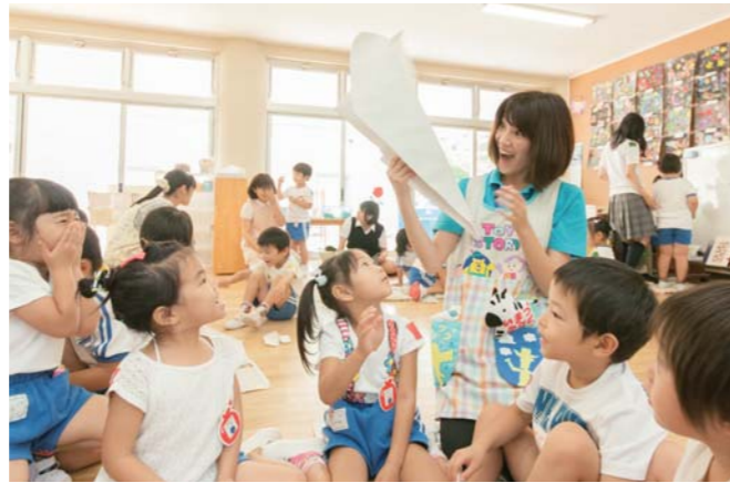
「おおきな紙飛行機」できちゃった!