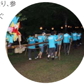
あたりは暗くなり提灯に灯りがともる

8月3日(日)、在学生と教職員の有志が「石上げ祭」に参加し、尾張富士の山頂をめざしました。参加者には新入生も多く、彼らにとっては、まさに未知のお祭り。最初スタートした時は平坦な道でしたが、すぐにとんでもない急斜面が目の前に立ち上がり、ひたすら登り続けること1時間以上。ついに山頂に到着した時には周りはすでに真っ暗になり、参加者全員が汗だくになっていました。その後、やぐらにくくりつけられていた大石を降ろして、神様に奉納。つらくないと言えば嘘になりますが、それ以上の達成感を感じることができる「石上げ祭」。「来年も、また大石を奉納しよう!」という思いを胸に、山頂を後にしました。