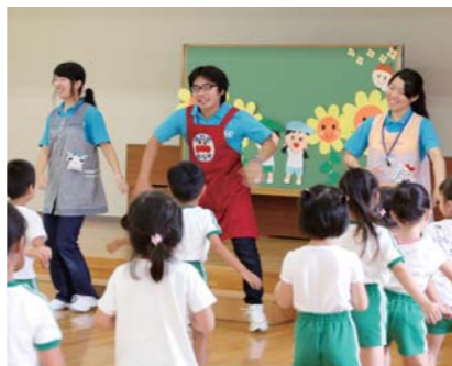
「左右にふりふり」元気体操だよ