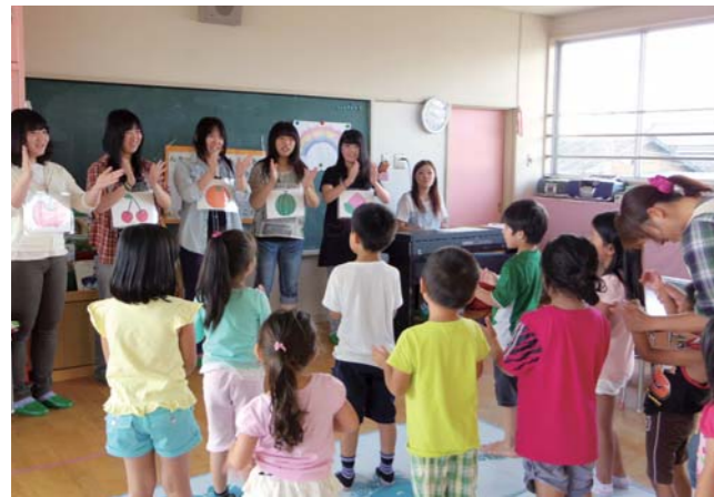
「歌あそび」で笑顔いっぱい