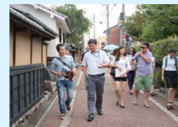
古い町並みを散策