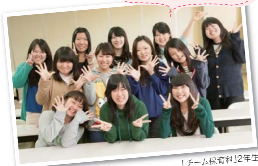
「チーム保育科」2年生