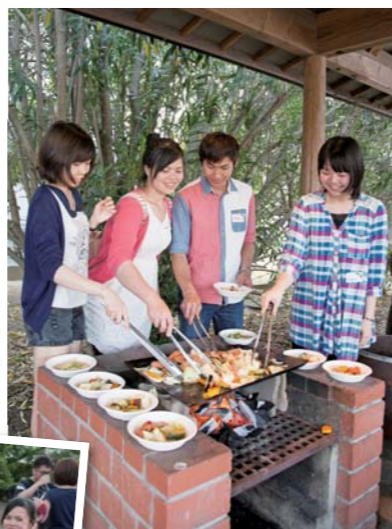
どんどん焼けてるよ!