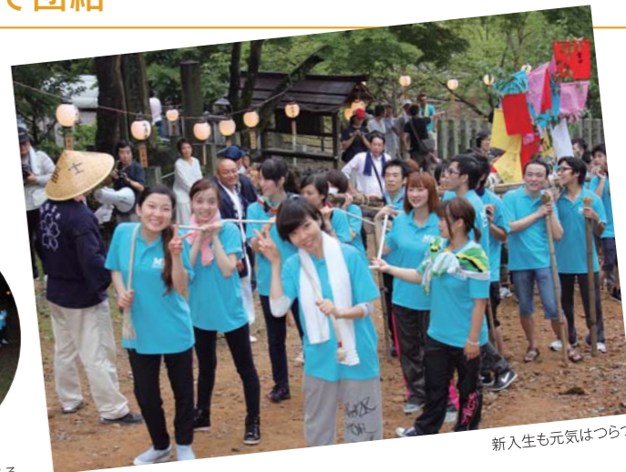
新入生も元気はつらつ