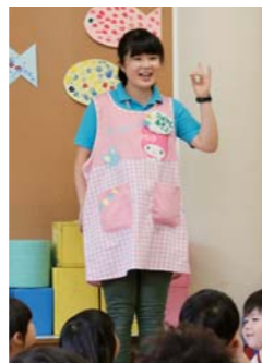
はじまり、はじまり...