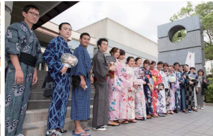
コミュニティプラザ前に集合!