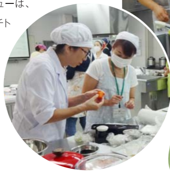
先生の丁寧な説明に納得