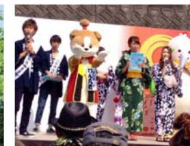
「中山道鶴沼宿まつり」で犬山市をPR