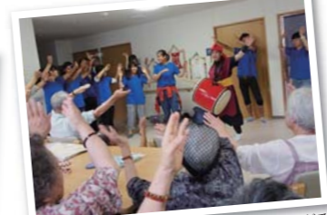
みんな「エイサー」のリズムで盛り上がる