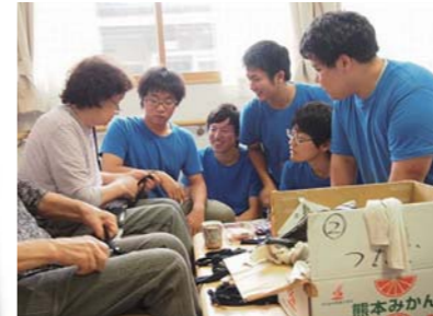
「新田高齢者集合住宅」で在宅被災者を訪問