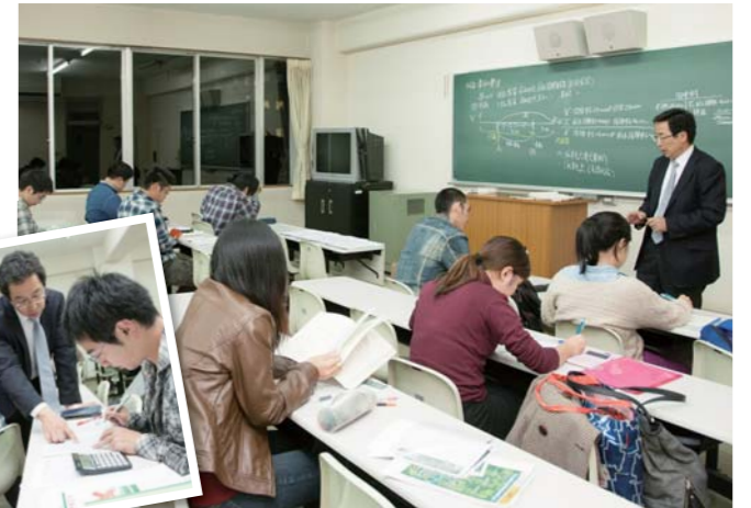
内容がわかりやすい、簿記が好きになるヒミツがいっぱい! かつまるる!