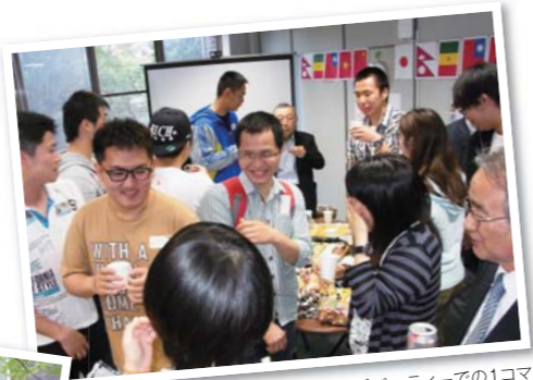
開所パーティーでの1コマ

今年度、名経にはアジア圏を中心に約60名の留学生が入学しました。現在、犬山キャンパスでは留学生と日本人学生、教職員が互いの文化を理解しようと、多文化交流の輪が広がっています。その一つが、5号館1階に新たに開設された「留学生支援室(International Student Support Office)」であり、留学生と日本人学生との交流をさらに深めるイベントが企画されています。その第1弾として、5月2日(金)にはISS開設を記念する「開所パーティー」を開催。留学生をはじめ、日本人学生や教職員71名が参加し、交流を深めました。