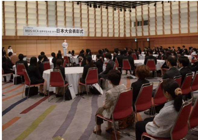
日本大会表彰式の会場