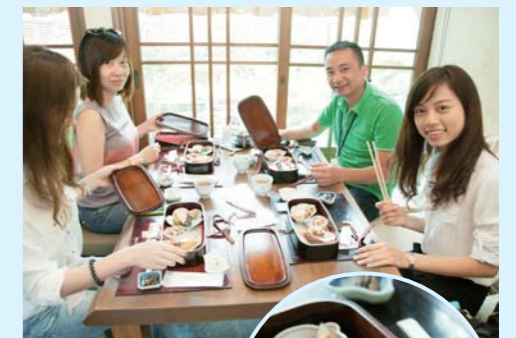
昼食は「玉手箱らんち」

まずは、華やかな食材がちりばめられた「玉手箱らんち」を楽しみながら交流を深め、その後、国宝犬山城へ。観光協会の方から歴史について説明を受けてから、天守まで登りました。眼下に広がる濃尾平野や木曾川の絶景に見とれながら、全員で記念撮影。最後は、昔ながらの町並みが残る城下町を歩きながら、楽しいひとときを過ごしました。