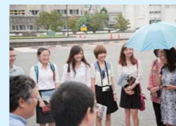
犬山城の解説に耳を傾ける