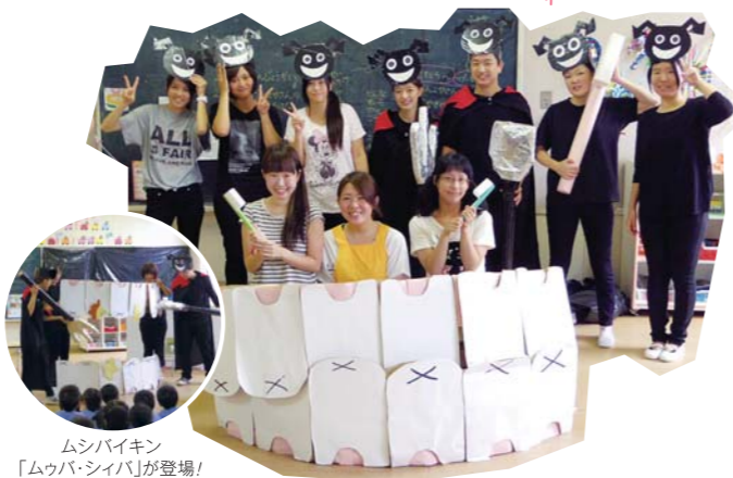
ムシバイキン「ムウバ・シバ」が登場!